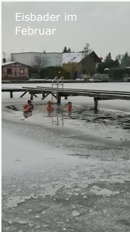
Eisbader im Februar