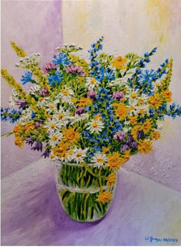
Feld- und Wiesenblumenstrauß

Unser Zuhause - das ist die Erde, das ist unser Land, das ist unsere Natur. Denn der Mensch ist auf die Natur angewiesen, um zu überleben. Dennoch bedienen sich die Menschen mit größter Selbstverständlichkeit an den natürlichen Ressourcen. Umso wichtiger ist es, unsere Erde zu schützen und lebenswert zu bewahren. Die Menschen müssen begreifen, dass sie nicht Herrscher über die Natur sind, sondern nur ein Teil davon.