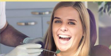
Die ERGO Zahnzusatzversicherung mit Sofortleistung. Vereinbaren Sie jetzt einen Termin.