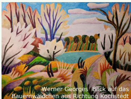
Werner Georges Blick auf das Bauernwäldchen aus Richtung Kochstedt

Robert-Bosch-Str. 59 | 06847 Dessau-Rosslau Tel. 0340-57 10 995 | info@horizont-werbung.de