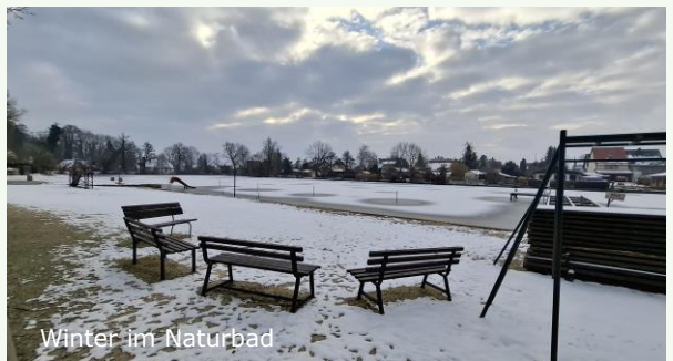
Winter im Naturbad