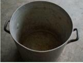
Aluminiumkochtopf um 1950