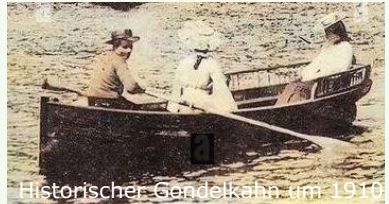
Historischer Gondelkahn um 1910